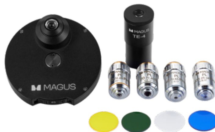
Фазово-контрастное устройство MAGUS PH1