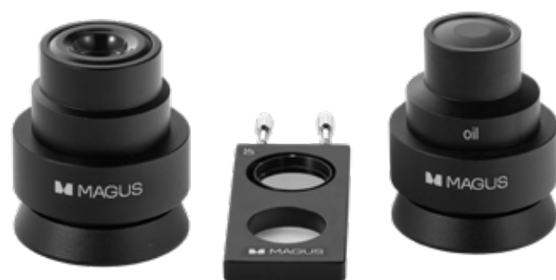
Конденсор темного поля MAGUS DF1 A 0,9 Конденсор темного поля иммерсионный MAGUS DF2 A 1,36-1,25ми Слайдер темного поля MAGUS DFS1